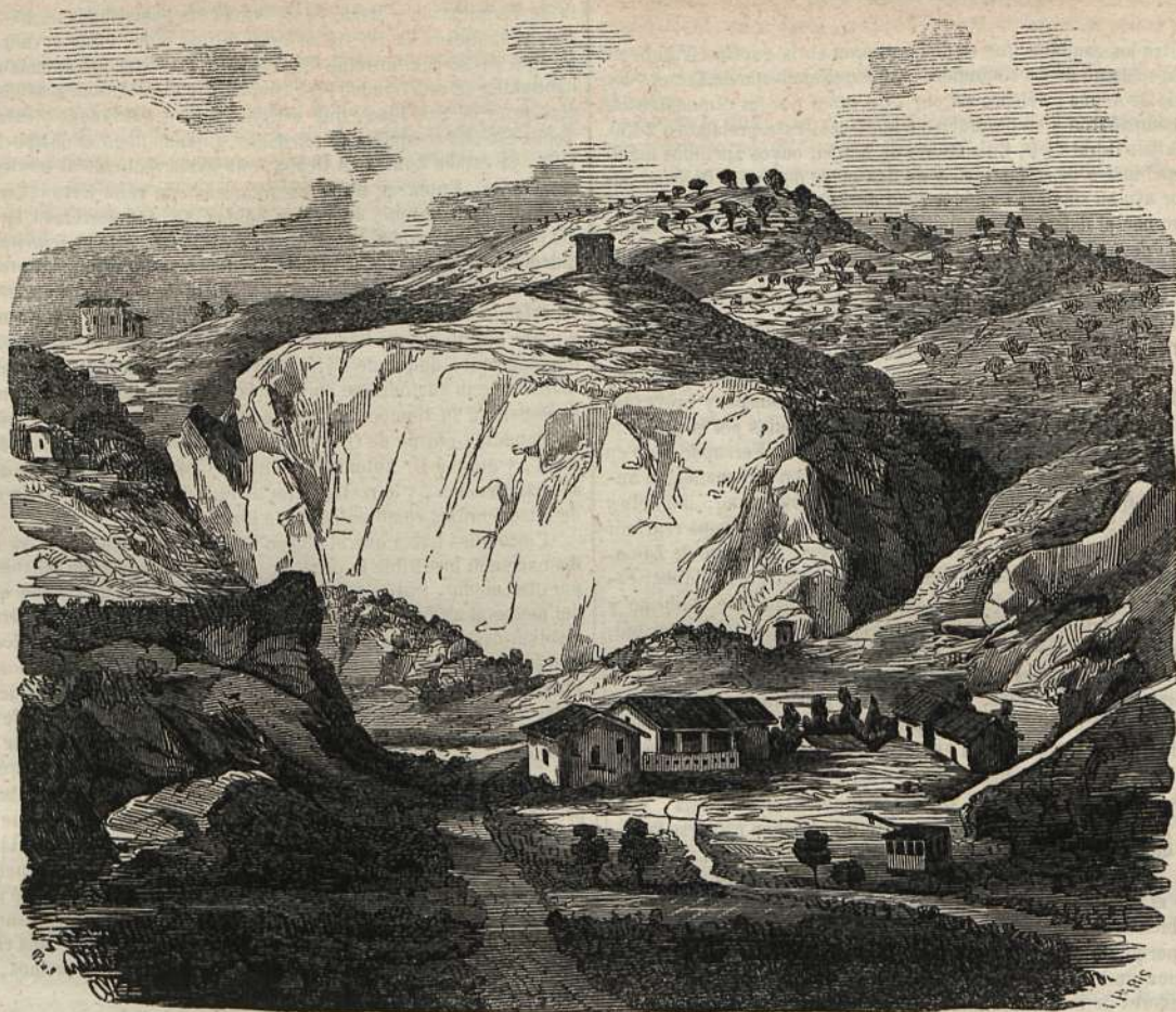
LAS SALINAS DE CARDONA, VISTA TOMADA DESDE EL PUNTO LLAMADO LAS GUIXERAS.

La parte del mineral de las salinas de Cardona en que se vé la sal descubierta, tiene media legua de estension, y de ancho sobre un cuarto de hora; pero teniendo en cuenta las señales que existen, tanto en la montaña como en sus alrededores, no se puede calcular hasta dónde puede llegar la sal, pues se manifiesta en la parte del Cierzo en la Coma, que dista del mineral once horas, en cuyo punto tiene principio el rio Cardoner, que pasa por debajo de las salinas con direccion á Suria; en épocas de trastornos, á un tiro de fusil del nacimiento del rio se ha sacado sal de piedra. A las vertientes de la Coma y pueblo de Cambrils, distante dos leguas escasas, hay una fuente abundante de agua salobre, que se calcula sea procedente del mineral de la Coma; y por la parte del Mediodia en Suria, que dista unas cuatro horas, hay otra mina de sal á la orilla del rio, siendo de advertir que es de buena calidad y produce cristales como la del mineral. La montaña del Castillo por la parte de Levante se halla situada encima de la sal, tanto que en el dia para construir la carretera que pasa por debajo del castillo á la orilla del rio, se ha tenido que quitar una gran porcion de sal para hacer el firme, y aun así en épocas de mucha humedad padecerá, pues una beta de la misma pasa por el rio. Sin embargo, en nada puede perjudicar al castillo y su montaña por tener éste una media legua de elevacion.