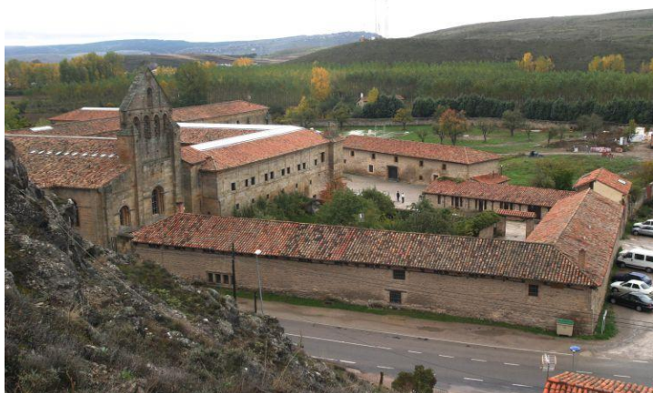
Imagen del Monasterio de Santa M a la Real en Aguilar de Campoo.

Esta ruta circular, de 57 km. y 1.000 m. de desnivel, con una dificultad técnica moderada, permite no sólo conocer el patrimonio de esa zona del norte palentino sino también disfrutar de la naturaleza, con amigos o en familia.