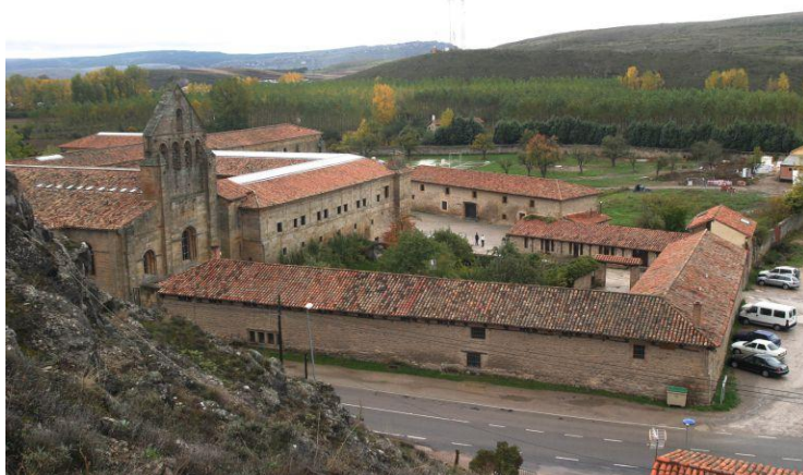
Imagen del Monasterio de Santa Mª la Real en Aguilar de Campoo / Manuel Brágimo (ICAL).

Esta ruta circular, de 57 km. y 1.000 m. de desnivel, con una dificultad técnica moderada, permite no sólo conocer el patrimonio de esa zona del norte palentino sino también disfrutar de la naturaleza, con amigos o en familia.